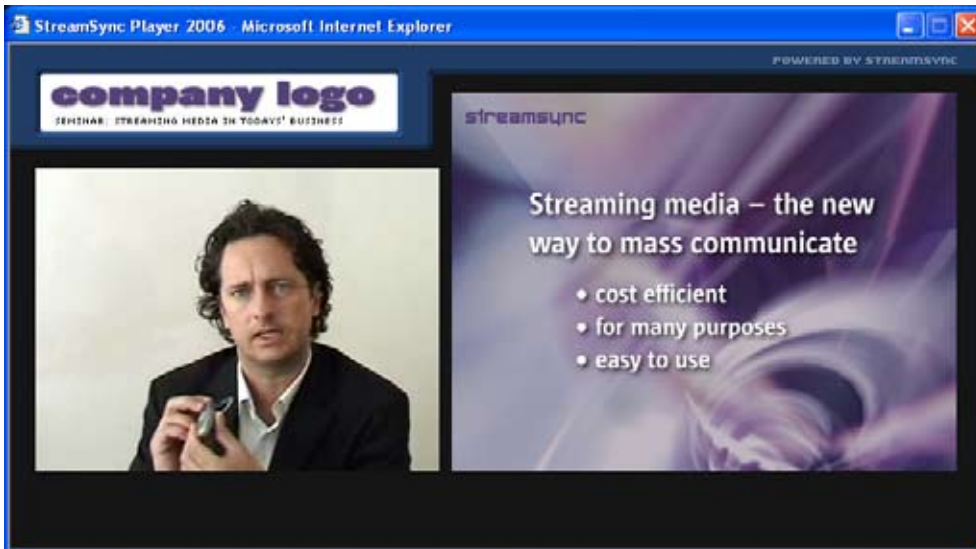
Exempel på grafiskt gränssnitt på webbsida med videofönster, bildfönster för t ex PowerPoint samt textinformation.